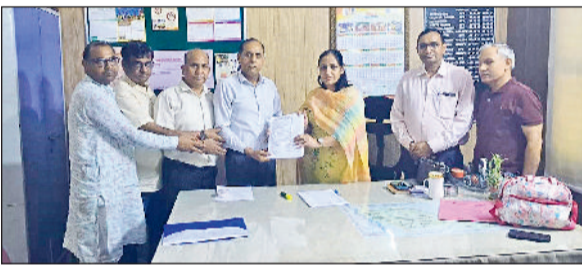
सोनीपत। डीपीओ को ज्ञापन सौंपते हुए संघ के प्रतिनिधि।