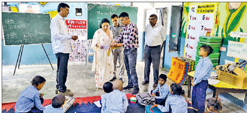
सोनीपत। गणित विषय के मूल्यांकन के दौरान लिवान में निरीक्षण करती शिक्षा अधिकारी।