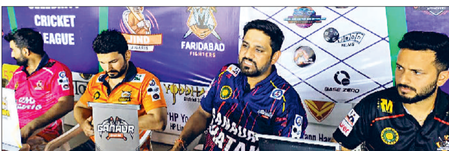
प्रेसवार्ता कर क्रिकेट लीग के बारे में जानकारी देते गन्नीर घातक टीम के कप्तान संदीप व साथ में दूसरी टीमों के कप्तान।