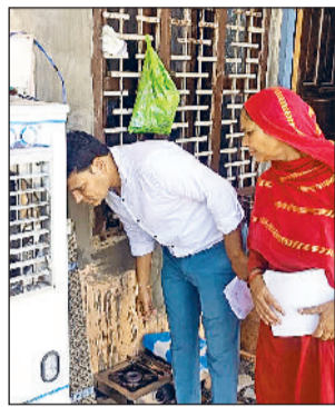
हरिभूमि न्यूज सोनीपत

बारिश का मौसम खत्म होने के बाद जिले में डेंगू और चिकनगुनिया के मामले तेजी से बढ़ने लगे हैं। मंगलवार को जिले में डेंगू के छह नए मरीज और चिकनगुनिया का एक मरीज सामने आया है। स्वास्थ्य विभाग के आंकड़ों के अनुसार अब तक जिले में डेंगू के कुल 46 मरीज और चिकनगुनिया के दो मरीज मिल चुके हैं। विभाग की तरफ से लोगों को जागरूक करने व लारवा मिलने पर उसे नष्ट करने के साथ लारवाही बरतने वालों को नोटिस जारी करने के अभियान को तेज कर दिया है। बता दें कि बारिश के बाद जहां-तहां पानी जमा हो जाने से मच्छरों के पनपने के लिए अनुकूल वातावरण बन गया है। वर्तमान में तापमान 30 से 35 डिग्री सेल्सियस के बीच रहने से डेंगू के मच्छरों के प्रजनन के लिए यह मौसम सबसे उपयुक्त माना जा रहा है।