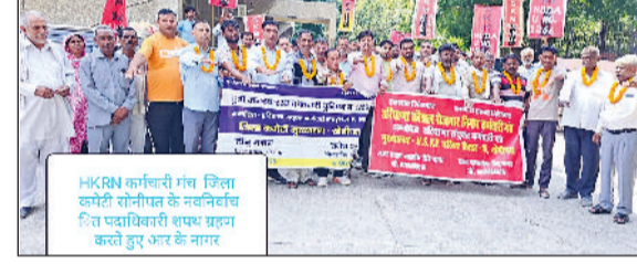
सोनीपत। एचएसवीपी में नवनियुक्त पदाधिकारियों को शपथ दिलाते हुए।