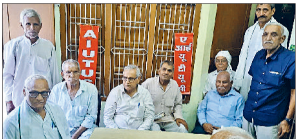
सोनीपत। बैठक में मौजूद यूनियन के पदाधिकारी एवं सदस्यगण।