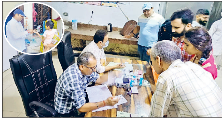
सोनीपत। फिजिशियन ओपीडी में मरीजों की जांच करते हुए चिकित्सक।

स्वास्थ्य विभाग के आंकड़ों के अनुसार अब तक जिले में डेंगू के कुल 46 मरीज और चिकनगुनिया के दो मरीज मिल चुके हैं। विभाग की तरफ से लोगों को जागरूक करने व लारवा मिलने पर नोटिस जारी करने के अभियान को तेज कर दिया है।