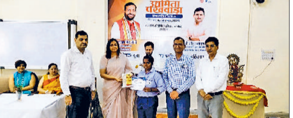
सोनीपत। कार्यक्रम के दौरान विद्यार्थियों को सम्मानित करते हुए।