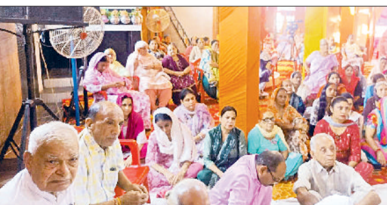
सोनीपत। कार्यक्रम के दौरान उपस्थित श्रद्धालुगण।

के महत्व और भगवान के प्रति सम्पर्ण की शिक्षा देते हैं, जिससे भक्तों को मोक्ष और आनंद की प्राप्ति होती है।