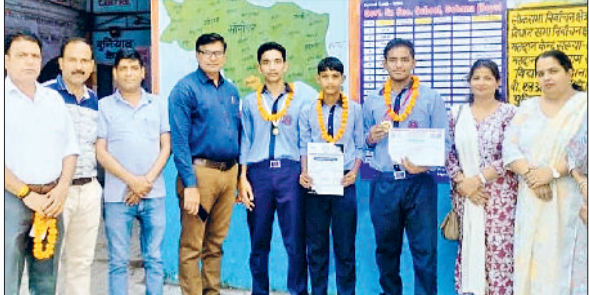
गोहाना। पदक विजेता खिलाड़ियों को सम्मानित करते शिक्षकगण।