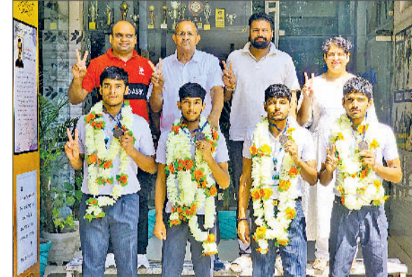
खरखौदा। खिलाड़ियों का स्वागत करते प्रताप स्कूल प्रबंधन।

गन्नीर घातक, सोनीपत सूरमा, चंडीगढ़ चैलेंजर्स, अंबाला अटैकर्स, पानीपत पैथर्स, जीए जिनोरज, गुरुग्राम लॉयर्स व फरीदाबाद फाइटर्स के बीच मुकाबला होगा।